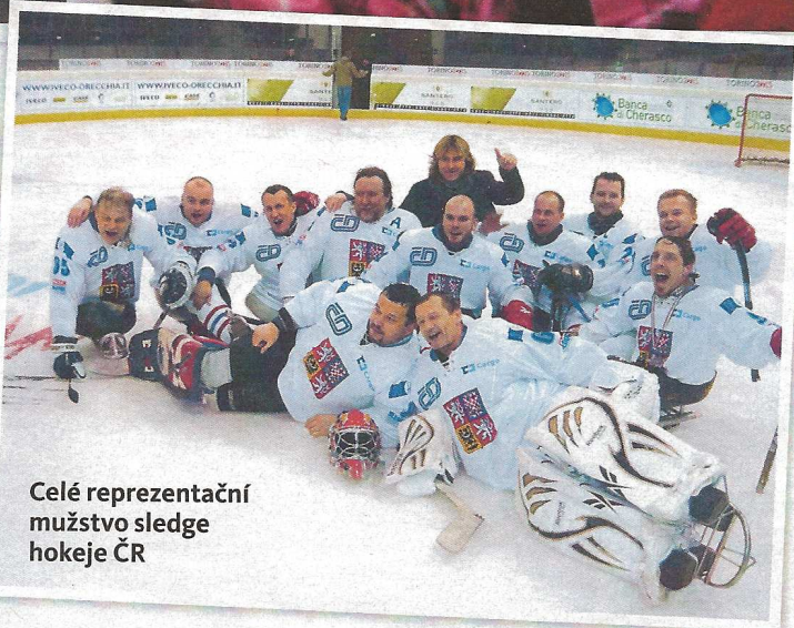
Celé reprezentační mužstvo sledge hokeje ČR

poetické. Neustále jsem padal, od ledu mi byla pěkná zima a nechápal jsem ostatní hráče, jak ještě zvládnou dávat góly či bránit. Veškerý pohyb na sledgi vypadá jednoduše, ale chce to mít pořádné břišní svaly, aby se na tom člověk udržel,“ směje se mladík, který se nakonec propracoval až do české